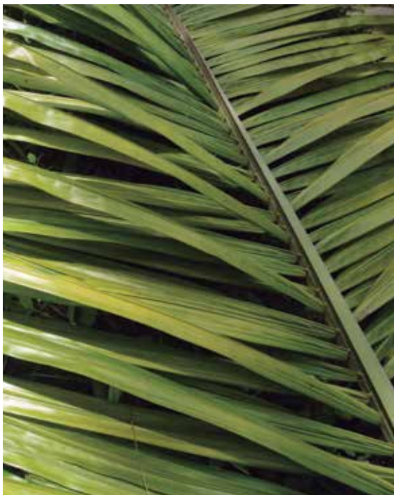
Figura 8. Detalle de foliolos en palma con clorosis generalizada en el tercio superior debido al avanzado estado de la enfermedad.