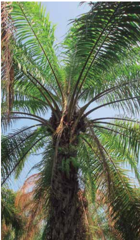
Figura 10. Colapso de flecha debido a la infección avanzada en los tejidos.