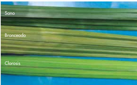
Figura 4. Comparación de los síntomas en un foliolo sano, uno con Pudrición del cogollo-Hoja clorótica (PC-HC) y otro con clorosis.