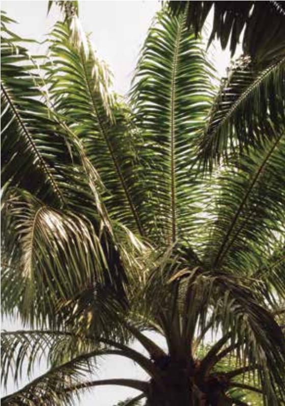
Figura 7. Clorosis generalizada en el tercio superior de la palma debido al avanzado estado de la enfermedad.

Posteriormente, la clorosis se generaliza en el tercio superior de las hojas de la palma y en los peciolos de las hojas cercanas que antes se encontraban aparentemente sanas (Figuras 7 y 8).