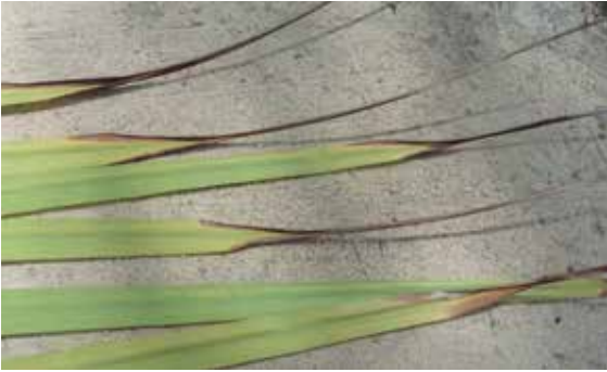
Figura 5. Necrosis en la punta de los folíolos.

Adicional a los síntomas de bronceamiento foliar, es posible observar en las palmas afectadas la necrosis en la punta de los folíolos bajeros, en las hojas del tercio superior (Figura 5).