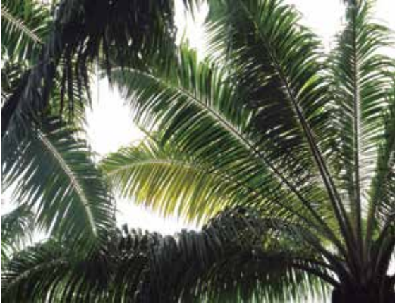
Figura 1. Coloración pálida típica de la hoja uno de una palma sana.