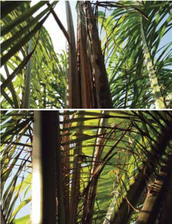
Figura 9. Lesiones en flechas y foliolos.

Luego de la aparición de la clorosis en las hojas, se observan lesiones en las flechas (Figura 9). Los síntomas severos que se observan al exterior de la planta indican que en los tejidos jóvenes internos se presenta infección avanzada que puede ser de consistencia acuosa y olor fétido, terminando con el tiempo en el colapso de las flechas (Figura 10).