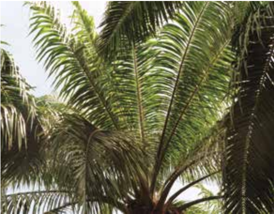
Figura 2. Clorosis de las hojas del tercio superior de una palma afectada por la Pudrición del cogollo-Hoja clorótica (PC+HC)