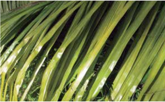
Figura 3. Bronceado de folíolos bajeros de una palma afectada por la Pudrición del cogollo-Hoja clorótica (PC-HC)

Uno de los primeros síntomas visibles es la leve clorosis localizada en el haz de los folíolos, inicialmente afectan los folíolos ubicados en tercio apical de la hoja (Figura 3), y al aumentar el daño se torna bronceado (Figura 4).