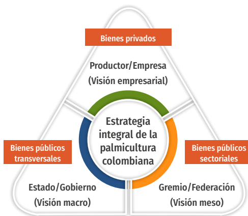
Figura 1. Articulación de actores involucrados en el desarrollo de la agroindustria de la palma de aceite

El engranaje sectorial de la agroindustria sobre el que se construye esta visión compartida incluye tres actores clave (Figura 1) que se articulan en beneficio del crecimiento y desarrollo del sector: los palmicultores (nivel empresarial), Fedepalma (nivel meso) y el Gobierno (nivel macro). En el caso de los primeros, sus decisiones de inversión y adopción tecnológica, así como sus prácticas gerenciales, orientan sus resultados económicos y su capacidad de innovación. En cuanto a Fedepalma, como el gremio de los palmicultores, contribuye a la articulación del engranaje sectorial, tanto en la generación de bienes públicos sectoriales (apoyándose, entre otras cosas, en los instrumentos de la parafiscalidad palmera), como en la influencia que tiene en acciones del Gobierno y de los productores. Finalmente, el Gobierno (en sus distintos niveles, nacional, departamental y municipal) es el responsable de que se formulen e implementen políticas públicas que permitan la provisión de bienes públicos transversales y de que se emita normatividad coherente con el desarrollo sectorial.