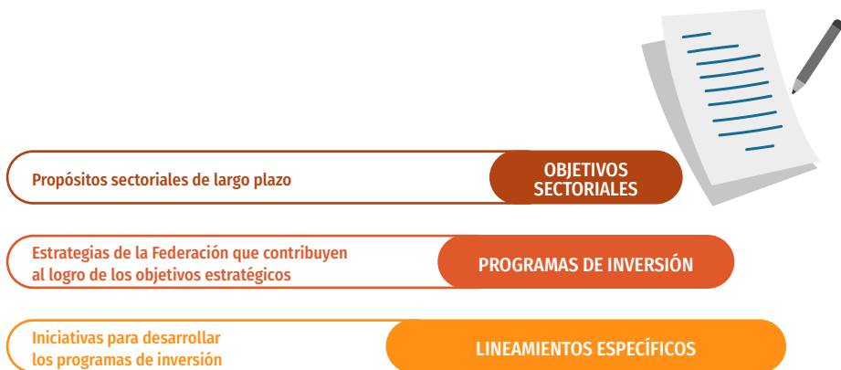
Figura 5. Despliegue de los objetivos dentro del proceso de planeación de la inversión sectorial

En cuanto a los programas de inversión, para la vigencia 2024 se proponen seis, dos ejecutados por Cenipalma y cuatro por Fedepalma, así: 1) Programa de investigación, 2) Programa de extensión, 3) Programa de comercialización y diferenciación en sostenibilidad, 4) Programa de promoción y mercadeo, 5) Programa de relacionamiento y comunicaciones y 6) Programa de transformación institucional.