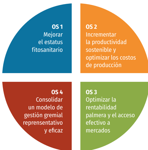
Figura 4. Retos/objetivos sectoriales

Estos objetivos sectoriales se desarrollan en programas de inversión a los que se destinan los recursos del FFP 3 y estos programas, a su vez, se despliegan en un conjunto de lineamientos específicos que consisten en estrategias para contribuir, desde el gremio, al logro de los objetivos. Dichas estrategias conforman un marco de referencia para que se formulen y prioricen proyectos de inversión con entregables concretos de utilidad para el palmicultor. El despliegue de los objetivos sectoriales en lineamientos específicos se presenta en la Figura 5.