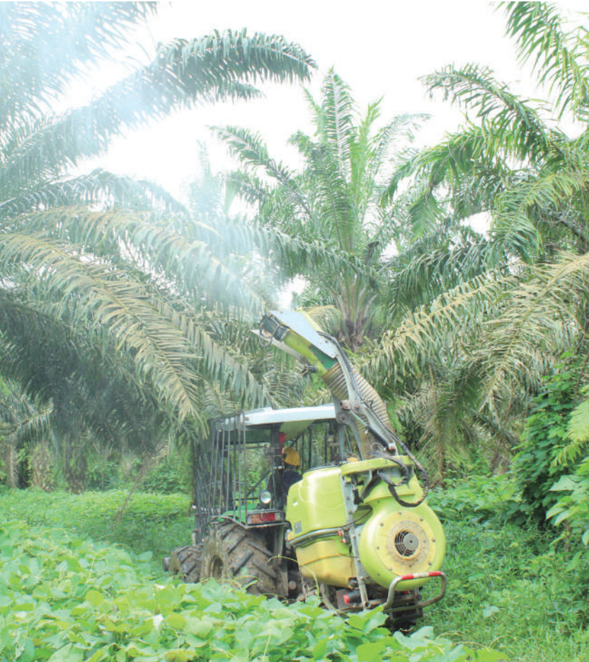
Figura 17. Las aplicaciones de insecticida son medidas de choque, específicas para prevenir la dispersión de vectores cuando se eliminan áreas foco completas.