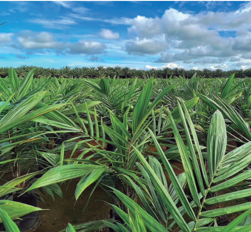
Figura 18. Para seleccionar el material de siembra, conozca previamente el comportamiento de la ML en los cultivares presentes en la zona.

La respuesta de estos cultivares con alguna resistencia es mejor si se reduce la presión del inóculo ocasionado por focos vecinos, lo cual es complementario al principio de manejo con enfoque regional.