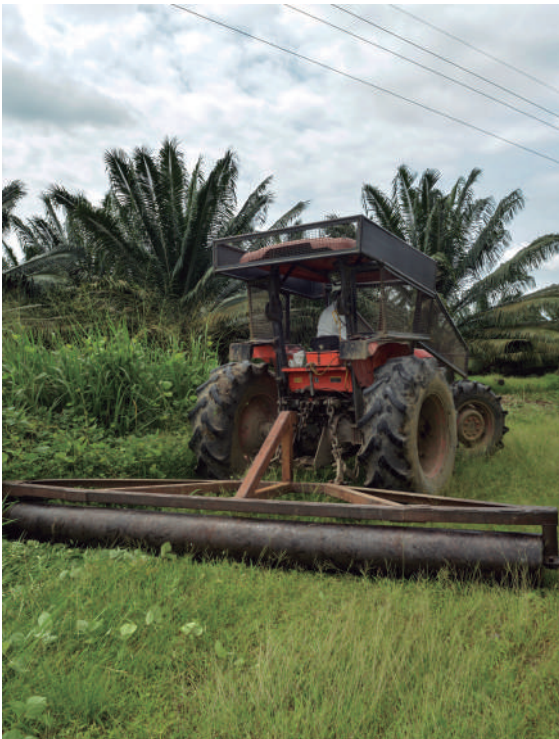
Figura 15. Control mecánico de las poblaciones de vectores de la ML mediante el volcamiento de gramíneas y ciperáceas.

Realizar control directo de los posibles vectores alojados en la vegetación acompañante, mediante el uso de implementos como arado, rastras y rolos, entre otros.