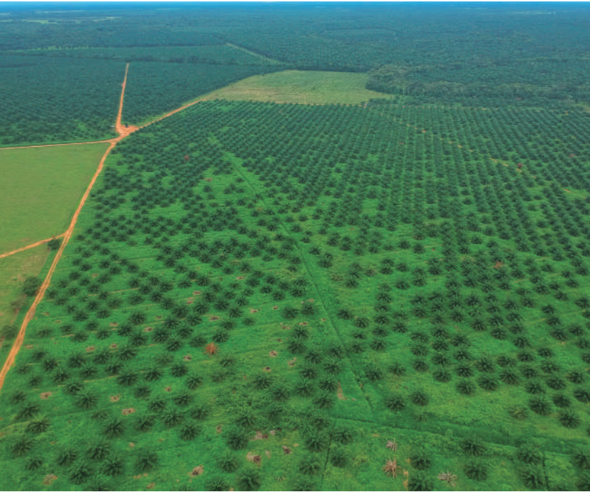
Figura 11. Foco de Marchitez letal en palma joven.

La decisión de eliminar un área foco es empresarial, administrativa y económica, se fundamenta en el análisis de la tasa de desarrollo, incidencia acumulada, riesgo de contagio de las áreas cercanas, producción de fruta y las condiciones agronómicas presentes en el lugar. Se debe tener en cuenta que el foco es más amplio que el área circunscrita por palmas con síntomas visibles.