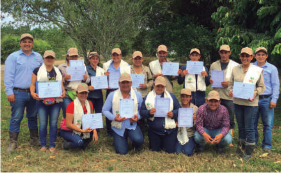
Figura 7. Grupo de censadores fitosanitarios capacitados y con certificado SENA.