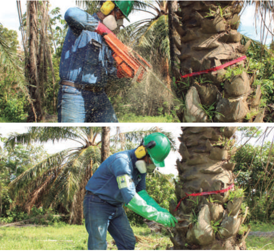
Figura 9. Labor de eliminación de palmas enfermas mediante inyección de herbicida.

En el caso de la eliminación química se requiere, como labor adicional, verificar que todas las hojas de la palma inyectada se secaron completamente en máximo diez días. De lo contrario, realizar de inmediato la eliminación mecánica.