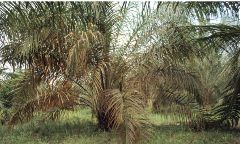
Figura 22. Palmas con deficiencias nutricionales y/o afectación por plagas dificultan el diagnóstico oportuno.