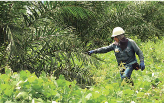
Figura 8. Censo fitosanitario periódico para detección oportuna de palmas enfermas.

Una vez identificada la palma enferma, es necesario eliminarla inmediatamente, utilizando métodos químicos o mecánicos avalados por el Instituto Colombiano Agropecuario, ICA.