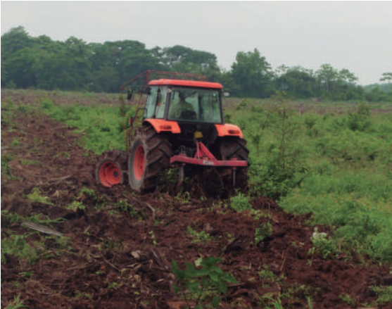
Figura 16. Control mecánico de las poblaciones de vectores de la ML mediante la disturbación de la capa superficial del suelo.

Al eliminar áreas foco completas, se deben tomar medidas de aplicación de un insecticida sistémico dirigido al follaje y/o al suelo para reducir la diseminación de insectos infectados con la ML a zonas vecinas sanas, ocasionada por la perturbación del ambiente, lo cual se conoce como "efecto salpique".