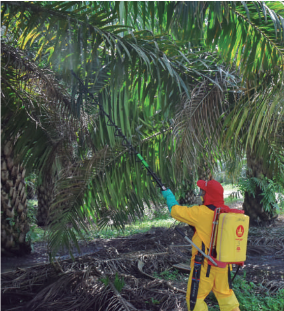
Figura 14. Aplicación de insecticidas químicos o biológicos para el control de vectores de la ML.

En la aplicación de insecticidas químicos o biológicos para el control directo de los posibles vectores es indispensable verificar los elementos que garantizan la efectividad de las aplicaciones: selección acertada del producto, dosis y concentración, el momento adecuado y la tecnología de aplicación correcta, atendiendo la normatividad ICA vigente.