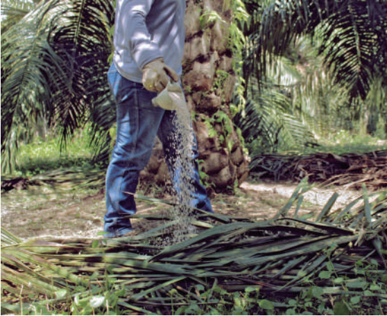
Figura 21. Buenas prácticas de fertilización y nutrición adecuada del cultivo.

Llevar a campo solo las mejores plántulas mediante una rigurosa selección en el vivero es importante para el adecuado desarrollo de las palmas; además, se debe buscar la corrección de las limitantes físicas y químicas del suelo, el manejo del agua y la nutrición balanceada. Palmas con síntomas de amarillamiento, secamiento o pudrición de racimos ocasionadas por deficiencias nutricionales o estrés por déficit o exceso de agua, reducen la calidad del diagnóstico y retrasan la eliminación oportuna de palmas enfermas.