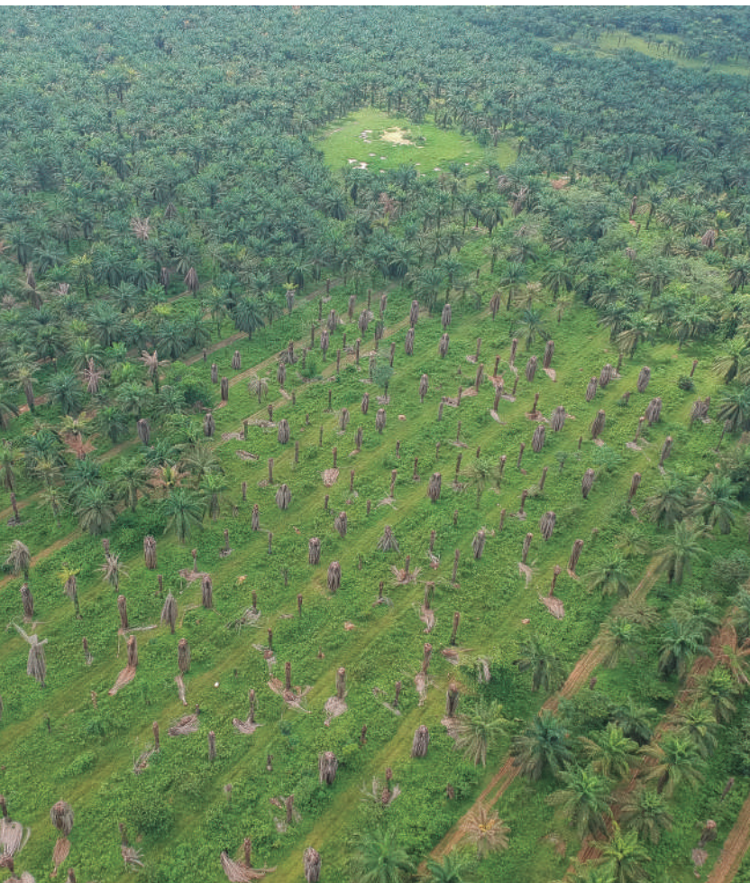
Figura 10. Foco de Marchitez letal en palma adulta.