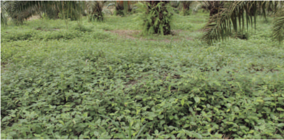
Figura 19. Establecimiento de coberturas leguminosas.

Dentro de las mejores prácticas agronómicas sobresale el establecimiento de coberturas leguminosas, el cual está incluido en el principio de control de posibles vectores, constituyéndose en la medida de manejo preventivo más importante.