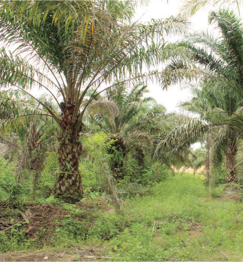
Figura 23. Lotes sin mantenimiento adecuado también dificultan el diagnóstico oportuno.

Quando no se aplican las buenas prácticas agrícolas, las plagas y enfermedades toman ventaja.