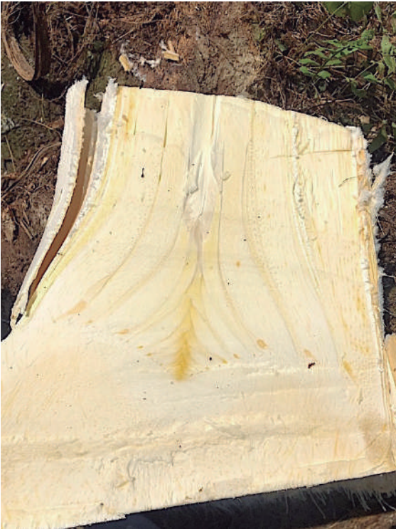
Figura 5. Tejidos internos sin alteraciones visibles en palma con ML.

d. En estados tempranos, los tejidos internos del estípite, meristemo y cogollo no presentan alteraciones visibles, este detalle es importante para diferenciar los síntomas de ML de otros trastornos como pudriciones de estípite, Pudrición del cogollo severa o daños por barrenadores.