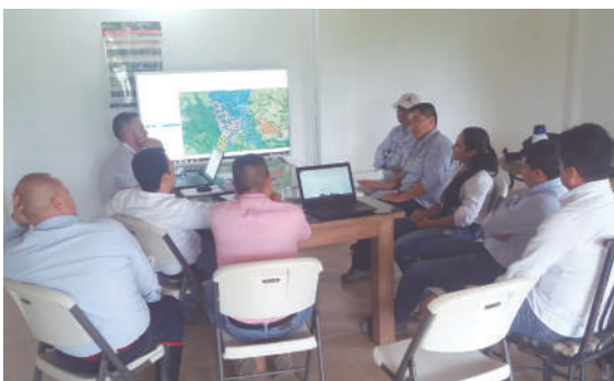
Figura 24. Grupo de palmicultores de plantaciones vecinas reunidos concertando acciones de manejo.

Es necesario establecer mesas de trabajo permanentes entre plantaciones que compartan focos de la enfermedad para definir la estrategia regional de mitigación de la ML.