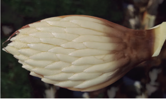
Figura 6. Daño característico de inflorescencia interna en palma afectada por ML.

e. El único síntoma interno típico es la pudrición con aspecto aceitoso de la base de algunas inflorescencias internas.