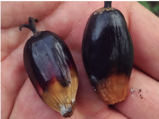
Figura 3. Detalle del desprendimiento de fruto en palma afectada por ML.