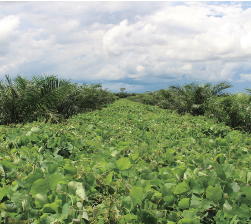
Figura 13. Cobertura leguminosa o tipo “hoja ancha” afecta las poblaciones de vectores de la enfermedad.