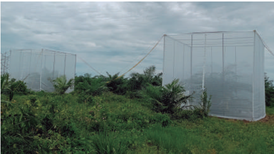
Figura 12. Casas de malla experimentales donde se realizan pruebas de transmisión de Candidatus Liberibacter con posibles vectores de ML.

Debido a que Candidatus Liberibacter no puede desplazarse de forma autónoma, requiere de insectos que la ayuden a transportarse. Existen sospechas sobre diferentes vectores que pueden portar este patógeno. Actualmente, las investigaciones sugieren que Haplaxius crudus es un potencial transmisor; sin embargo, Cenipalma está enfocado en corroborar esta información e identificar otros posibles vectores de la enfermedad.