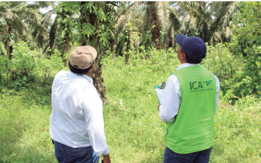
Figura 25. El ICA es aliado estratégico de los palmicultores para enfrentar la Marchitez letal (ML).

Es fundamental brindar apoyo permanente a la gestión de inspección, vigilancia y control que desarrolla el Instituto Colombiano Agropecuario, ICA. La ML está declarada como plaga de control oficial según la normatividad vigente.