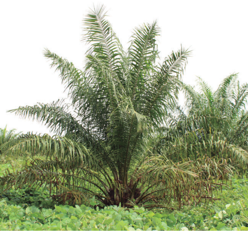
Figura 1. Palma afectada con Marchitez letal.

a. Secamiento progresivo de las hojas desde el ápice hacia la base y avance del daño por la punta y borde de los folíolos. Las hojas afectadas se ubican en diferentes estratos foliares dentro de la palma (no hay uniformidad en su ubicación).