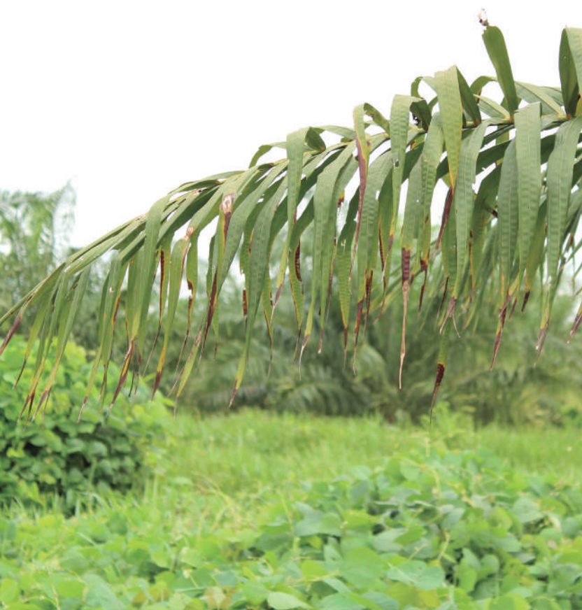
Figura 2. Secamiento típico de folíolos en una palma afectada por ML.