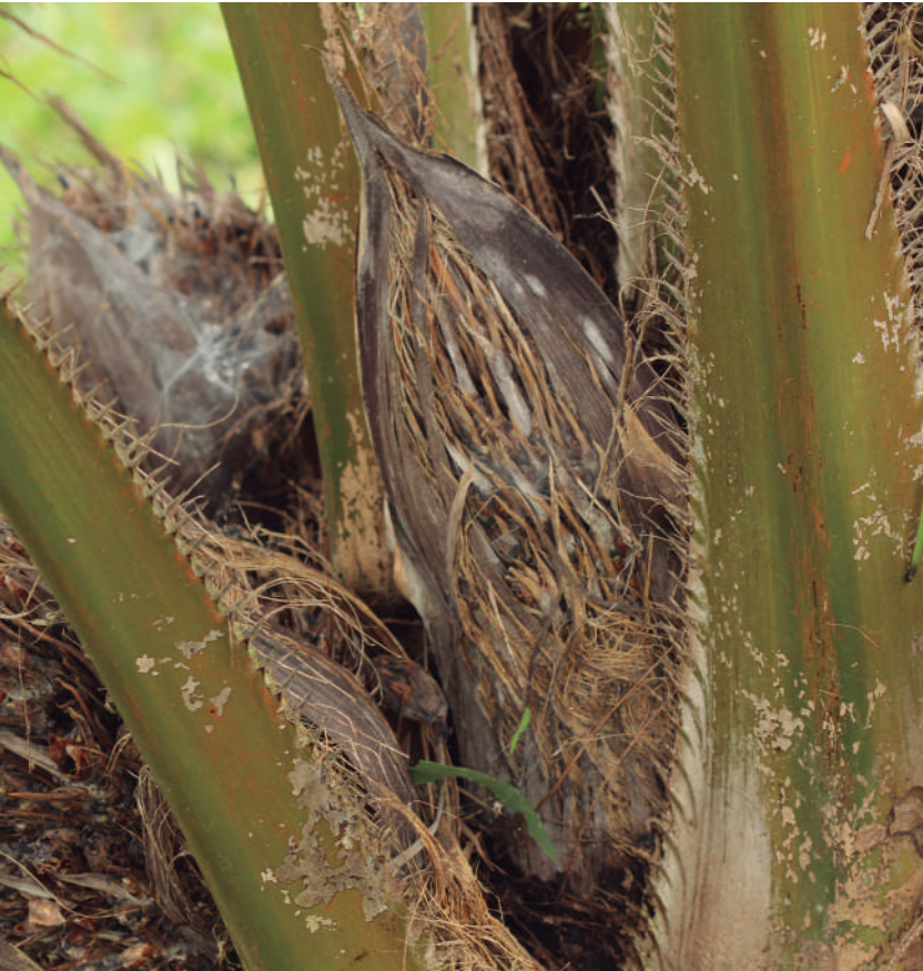
Figura 4. Característica de inflorescencia en palma afectada por ML.

c. Deseccación de inflorescencia con necrosis en las puntas de las espinas.