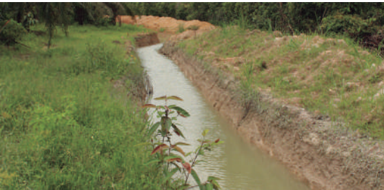
Figura 20. Limpieza y mantenimiento de drenajes.